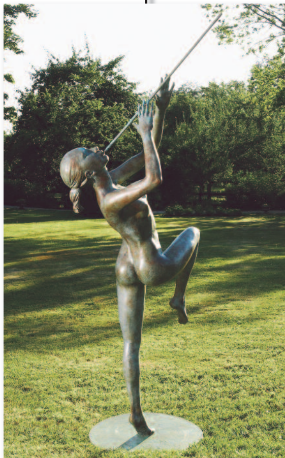
Musicienne - Bronze Haut. 232