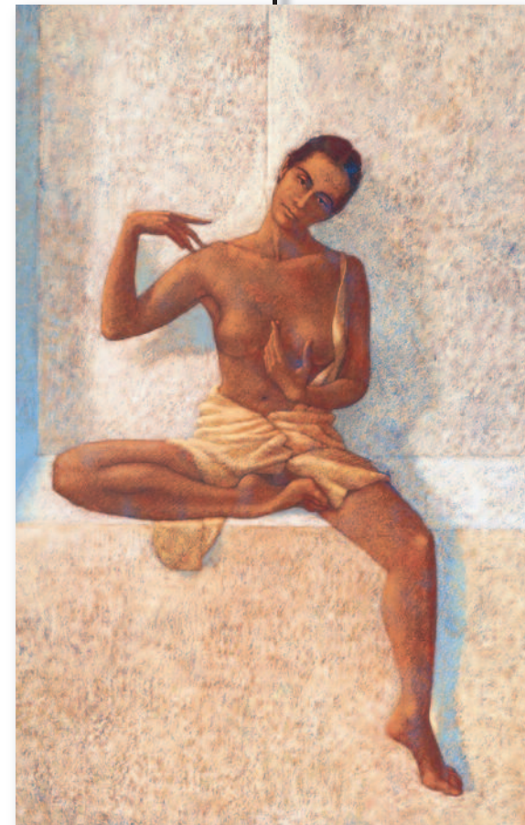
Les retrouvailles de l'absente 89 x 130